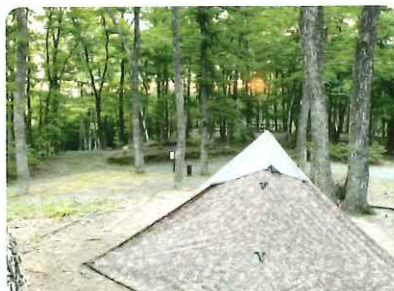
木立の中にあるオートキャンプサイト