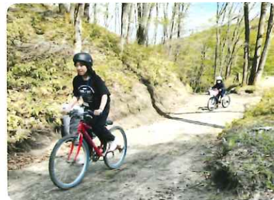
1,000mの本格的なMTBコース